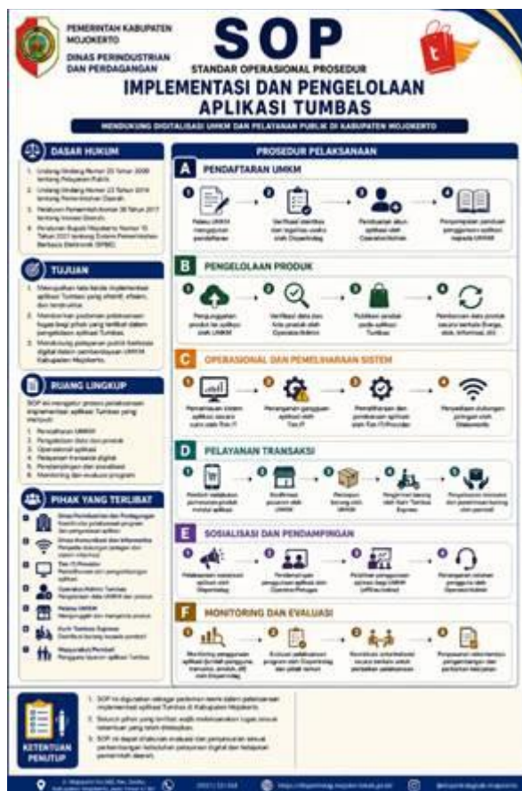
Gambar 3. SOP Aplikasi Tumbas