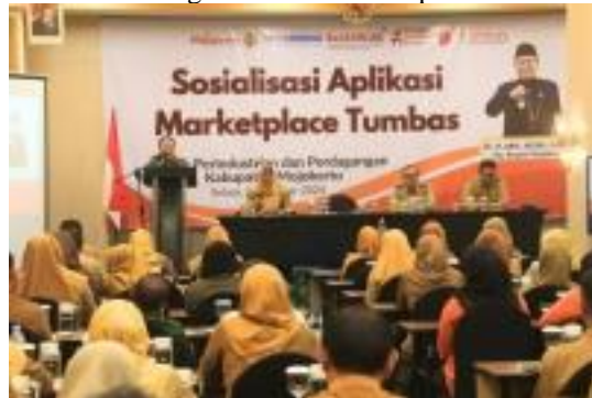
Gambar 2. Kegiatan Sosialisasi Aplikasi Tumbas